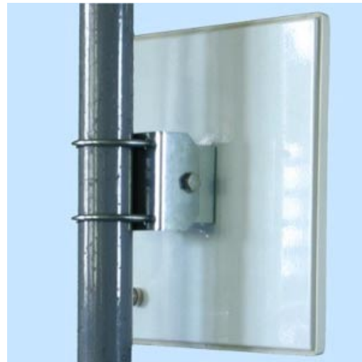
/ vertical polarization if mounted as shown