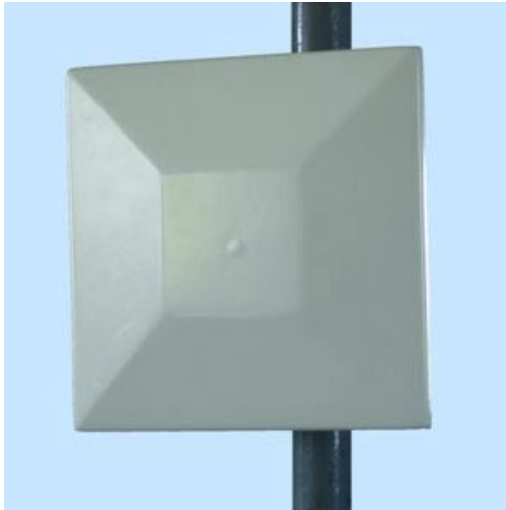
im Bild mit vertikaler Polarisation montiert

Flat panel antenna with radome for outdoor installations, 15 dBi gain. Radiation angle approx 30°, includes mast bracket for downtilt, mast diameter from 25 to 50mm, connector N female. Size 25x25cm, weight 1Kg.