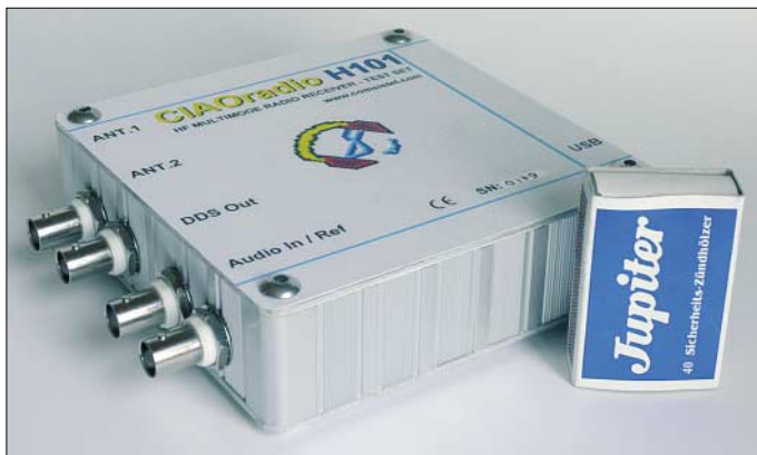
CIAO-Radio von außen

Der sympathische Kleine ermöglicht bei gutem Preis-Leistungs-Verhältnis einen günstigen Einstieg in die zukunftsweisende Empfängertechnologie. Das nur 11 cm × 13 cm × 3,5 cm große Kästchen trägt keine der sonst üblichen Buchstaben-Nummern-Salate als Bezeichnung, sondern hört auf den liebenswerten Namen CIAO Radio (eigentlich: Computer Interface Audio Out Radio ). Trotz des etwas hausbacken wirkenden Äußeren mit hervorstehenden BNC-Buchsen – hier hätte man sich etwas mehr italienischen Chic gewünscht – finden sich einige erfrischende Details in der Konzeption des SDR-Empfängers [1].