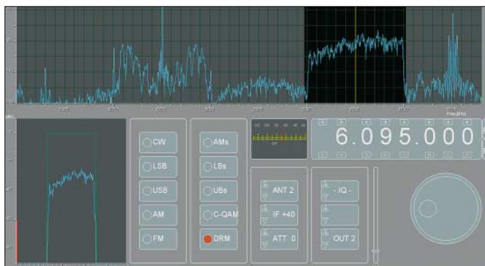
Programmoberfläche mit Darstellung verschiedener Modulationsarten

Bei einer Frequenzauflösung von 1 Hz reicht der nominal einstellbare Empfangsbereich von 0 Hz bis 30 MHz. Die Frequenzabweichung beträgt durchgehend etwa \pm 5 ppm. Im VLF-Bereich häufen sich dann, bei nachlassender Spiegelfrequenzunterdrückung, die Geisterstationen jedoch