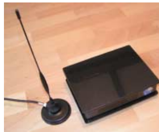
Unscheinbar, aber leistungsstark: das SBS-1 mit Magnetfußantenne.

Genau damit soll nun auch die Luftfahrt sicherer werden, denn bisher hatten nur die Fluglotsen am Boden einen Überblick über den Luftraum. Diese waren somit für die räumliche und zeitliche Staffelung aller Luftfahrzeuge alleine zuständig, was in der Vergangenheit leider nicht immer klappte. Folgeschwere Zusammenstöße von Flugzeugen in der Luft waren die Folge.