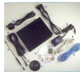
Der Lieferumfang des SBS-1: Auch alle erforderlichen Kabel sind enthalten.