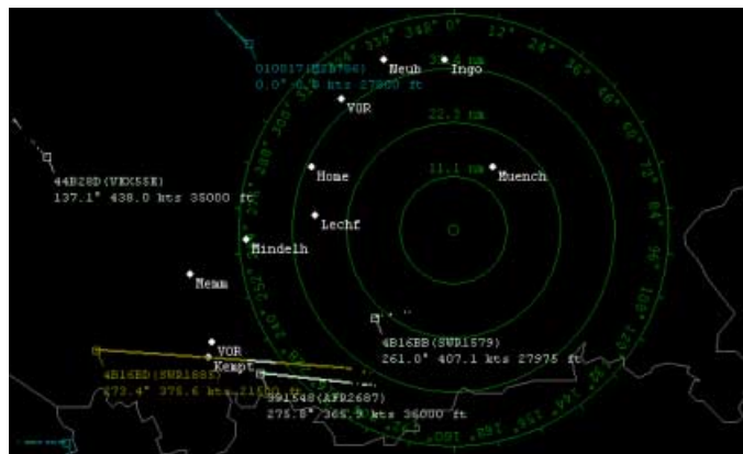
Die „Radaransicht“ mit eingeblendeten Flugzeugen und deren Bahnen. Optional können Städte und Funkfeuer eingeblendet werden.

Als grobe Orientierungshilfe können die Landesgrenzen in die Darstellung eingeblendet wer-