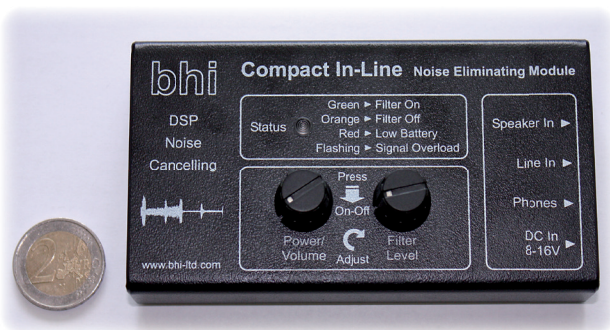
Bild 1: In der Praxis angehört: das „Noise Eliminating Module“ von bhi

Manchem Amateurfunkgerät ist konzeptionell bedingt die DSP-basierte Rauschreduzierungstechnik fremd. Speziell für solche Fälle hat die Firma bhi ein Modul zum Einschleifen in die NF-Leitung entwickelt. Wir haben uns das mal angehört.