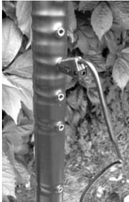
An den kleinen Buchsen wird mit den Bananensteckern der Wanderleitung das gewünschte Band vorgewählt.

17875 kHz: Die DEUTSCHE WELLE vom Sendestandort in Kanada kommt mit guter Verständlichkeit und mit fünf S-Stufen an. Der O-Wert von SINPO könnte mit 4 eingeschätzt werden. Ebenfalls mit O = 4 bringt