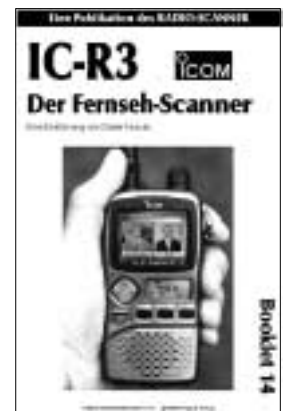
Neues Booklet über den IC/R3. Preis 15

Weitere Booklet-Titel entnehmen Sie bitte unserer Website!