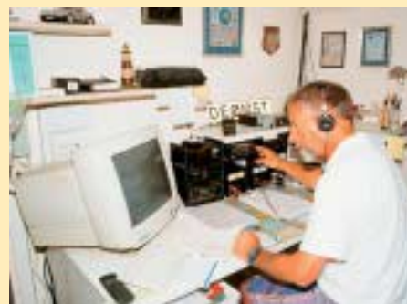
Ich hör doch was? Eine neue Insel – oder ein neuer Leuchtturm?