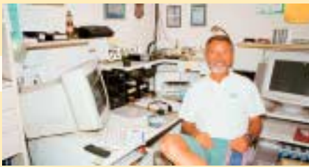
Das hat geklappt! Mit der Gap-Eagle einen neuen Leuchtturm gut gehört

Liegt zwischen dem Antennenkabel und dem Empfänger ein Antennenkoppler?